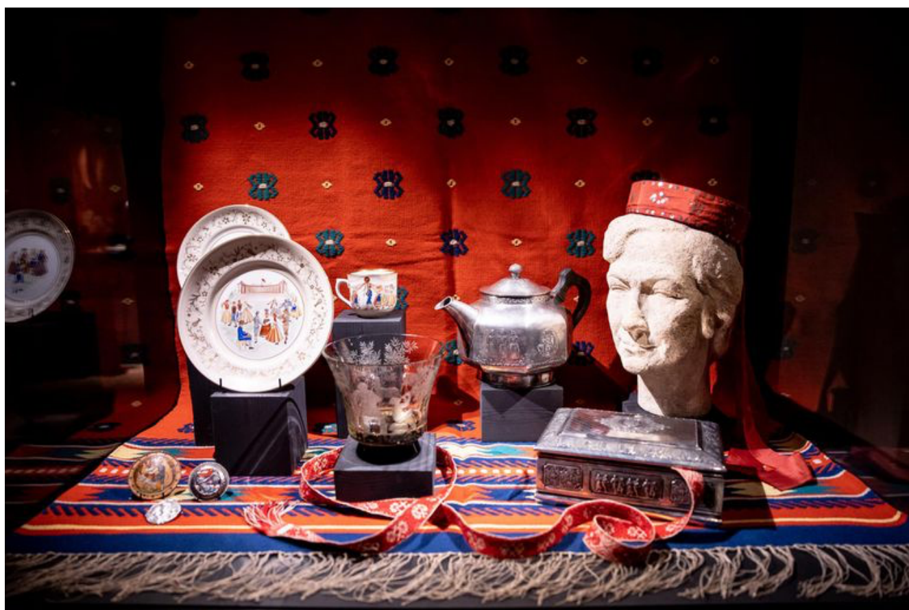
Kompositsioon «Laulev rahvas»

Uurin, kuidas 40ndatel uue võimu tulles ja pärast sõda selle rahvarõivaste teemaga läks. «Nüüd pean ütlema lause algusesse «mulle tundub», sest ma pole spetsialist,» räägib kunstnik, «aga mulle tõesti tundub, et mingis mõttes ta jätkus, sest võib-olla oli tunda, et kohalikel on midagi sellist vaja.»