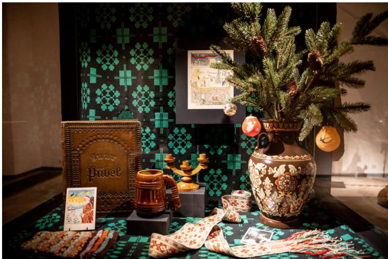
Vaikelu nimega «Jõulud-näärid». Näituse alguspunkt ja kättesaamatu ideaal.