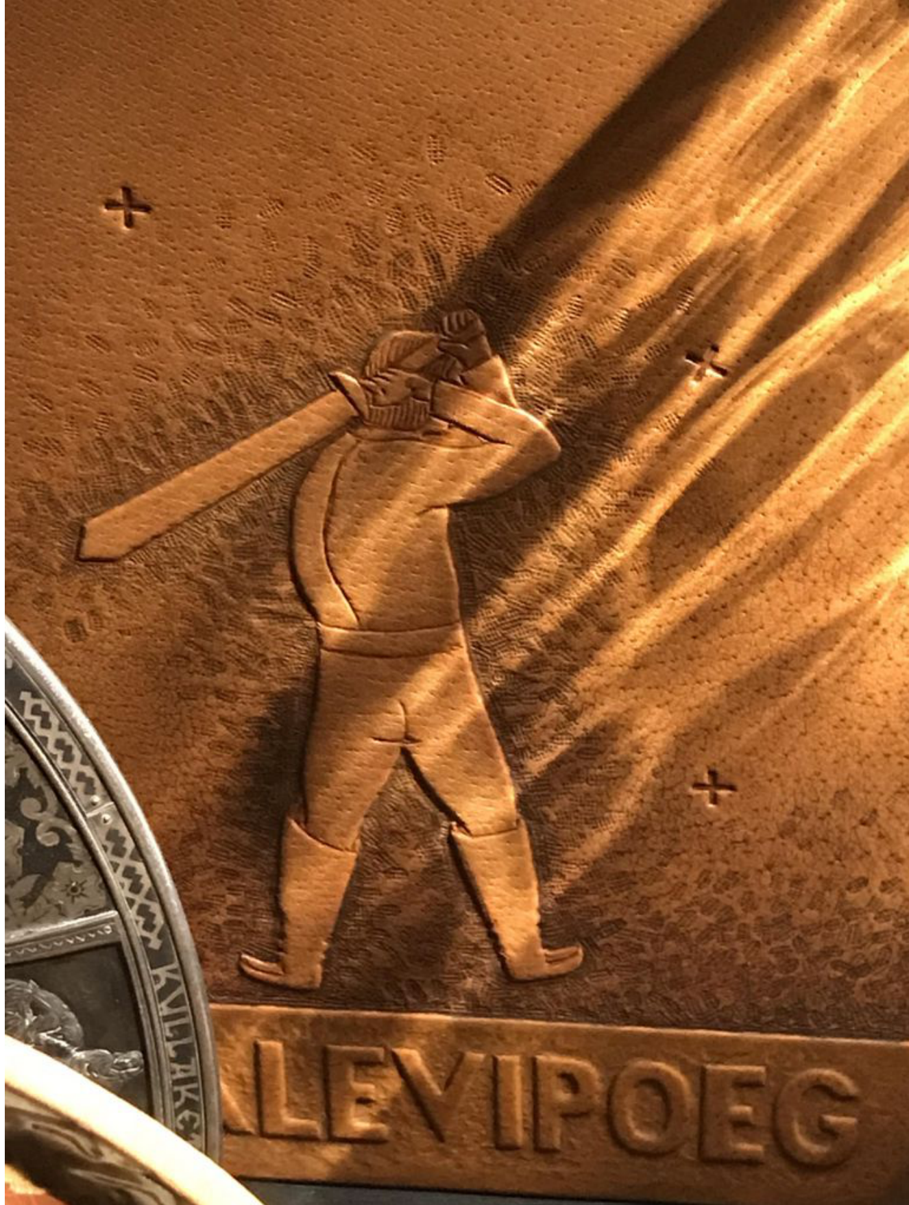
Nahkköites «Kalevipoeg» 30-ndatest

Vaatan 30ndatel Arved Saadi kujundatud nahkset Kalevipoja köidet vitriinis, millel nimeks «Kalevite kallis poega». Kalevipoeg sellel köitel ei tundu ootuspäraselt heroiline. Temas on midagi proosalist, inimlikku. Mõõk on